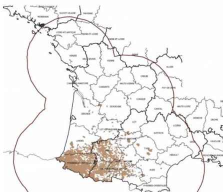
Carte de la Zone Régulée (ZR) MHE du 16/11/2023

Au 16/11/2023, 3 340 foyers de MHE ont été confirmés en France, et de nombreuses suspicions sont en cours (cf carte).